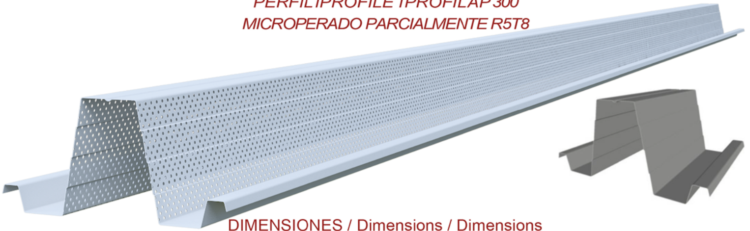
DIMENSIONES / Dimensions / Dimensions